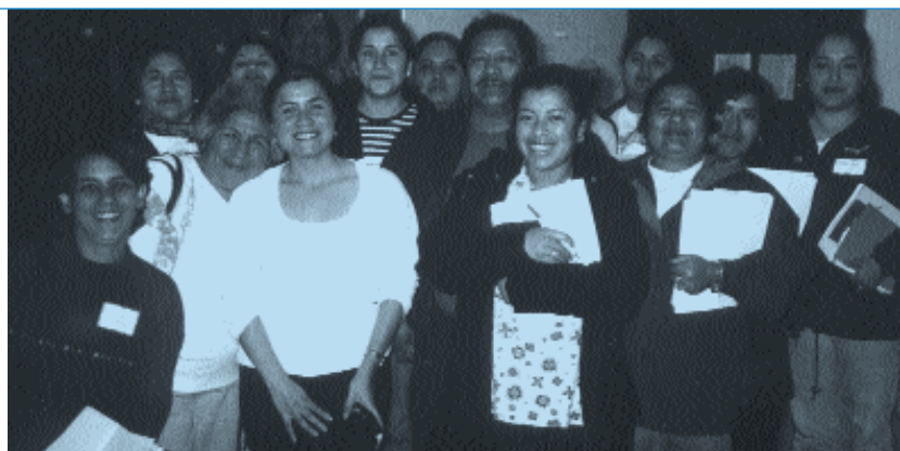
Líderes comunitarios entrevistan las necesidades de salud locales.

S e requiere una persona—ó más de una—para formar una sociedad o asociación. La Sociedad Comunitaria de South San Francisco (SSFCP) ( South San Francisco Community Partnership ) sabe esto muy bien.