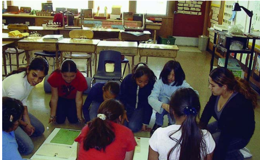
Estudiantes del grupo YES! y sus coordinadores aprenden juntos a trabajar en equipo mediante la creación de una pancarta del grupo.

alumnos de quinto año la oportunidad de llevar a la práctica métodos con los que participan de manera activa y social en sus comunidades. En uno de ellos, Photovoice, cada alumno recibe una cámara para retratar cosas importantes de la escuela, y más tarde, en el vecindario y la